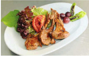
İşte her bir kalemi bin dert unutturan o meşhur pırzolalar. Porsiyonu 20 lira.